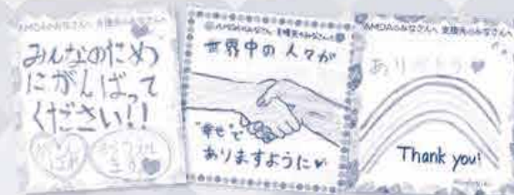
昨年のAMDA募金月間で組合員から 寄せられたメッセージの一部

昨年お寄せいただいた 「メッセージ」は丁寧に ファイリングした後、 AMDA社会開発機構へ お渡しし、大変喜んで いただきました♪