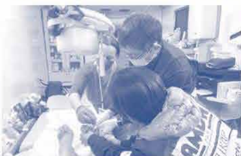
ハンガリーの仮設診療所にてAMDA医師たちが ハンガリー看護師とウクライナ避難者を診察するようす