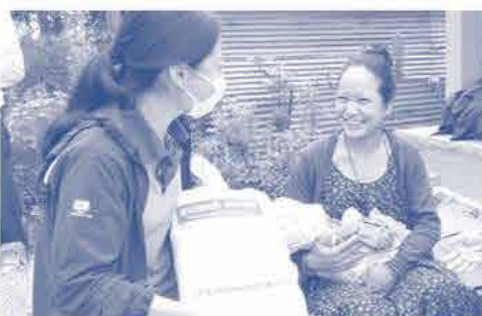
プレゼントされた「赤ちゃんキット~おかやまコープ」に 笑顔のお母さん