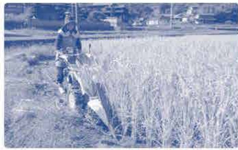
まず、バインダーで田んぼの 周囲を2周ほど刈ります。