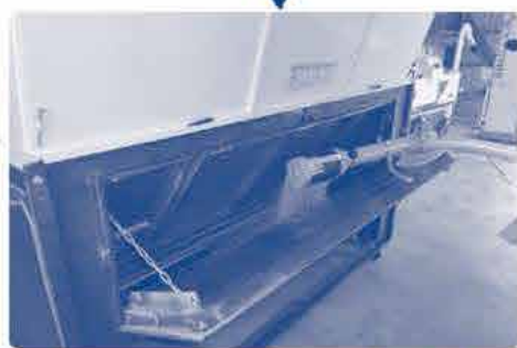
専用ホースでモミを乾燥機へ。