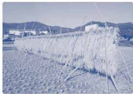
お隣の田んぼでは 昔ながらのハゼかけ 天日干しをしています。

心配された台風14号やカムシの被害も少なくてすみ、 きれいな米が収穫できました。 作業は体力勝負でしんどいけど、収穫したお米を見たら、 来年もがんばろうと思います。米作り、これからも応援してね。