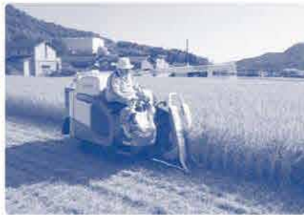
あとはコンバインで刈ります。