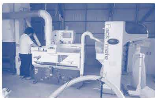
一晩ボイラーで 乾燥させます。