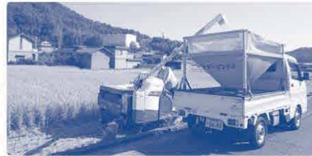
コンバインのタンクがモミでいっぱいになったら軽トラのコンテナに移します。