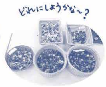
どれにしようかな??