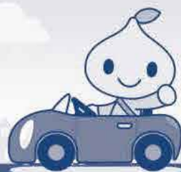
公式キャラクター ビットくん