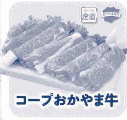
コープおがやま牛