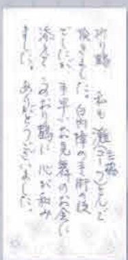
私も COOP 共済でお願いの書類と共に折り鶴をいただきました。お役に立てます。