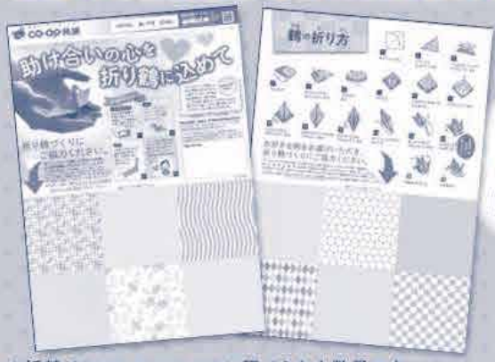
7月1回の注文書にセットされた「折鶴チラシ」