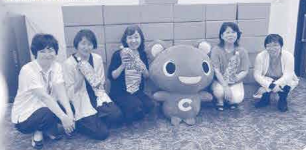
発送を待つ折鶴(40ケース)

この活動は、コープなごの職員から始まりました。その頃は共済金の請求事務の一部を各生協で行っていました。1日でも早く良くなりますように、と願いを込めて、自分で折った折鶴を1羽ずつ、請求書に入れて送付されたことが始まりです。その後、全国の生協組合員へと広がっていきました。