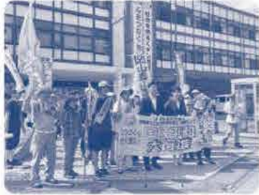
笠岡市役所を出発!

7月26日(金)平和行進に参加しました。 猛暑の中、笠岡市役所から菅原神社まで 平和を願って歩きました。給水ボランティアで みなさんの応援もしました!!