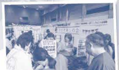
かけあしの会×ちょこっと応援隊