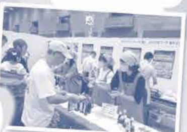
オタフクソース× 美術エリア