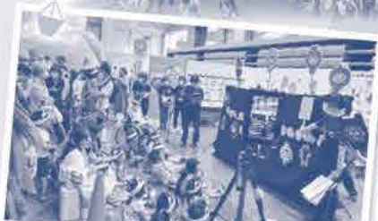
たべる・たい・せつ 応援隊