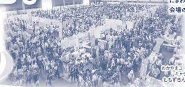
にぎわっている 会場のようす

9月28日(土)、コンベックス岡山にて『コープフェスタ 2024』を開催し、約23,000人が来場されにぎわいました。取引先や生産者など148団体が出展し、Cコレ商品やおかやま育ち、産直・地産地消、エシカル消費などの取り組みを、商品紹介や試食・販売、交流を通じてお知らせしました。