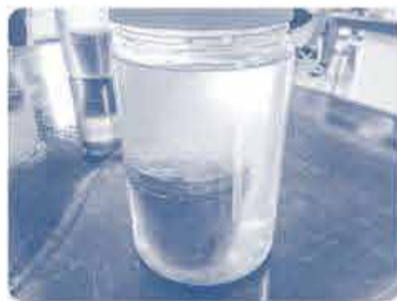
海水を入れた ビンにポットを 漬めて完成