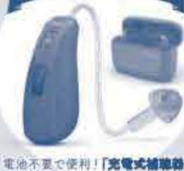
電池不要で便利!「充電式補聴器」