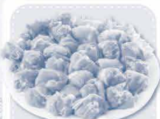
コープ おかやま若鶏