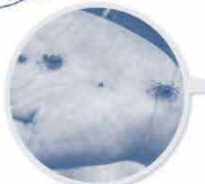
砂の中から カニが出ました