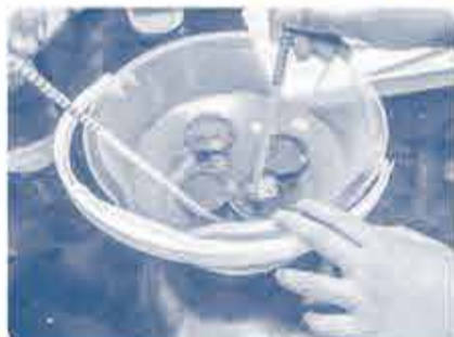
海水につけて 空気を抜く