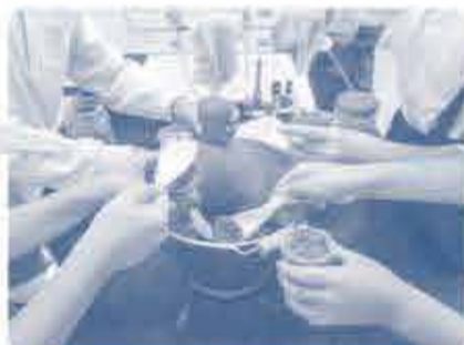
ポットに砂を入れ