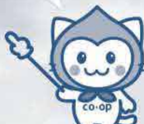
おかやまコープ公式キャラクター ももずきんにゃん。