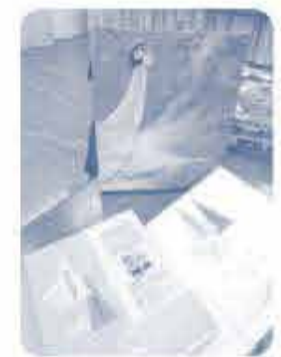
絵本の裏表紙には 蔵書マークをつけました

短い時間でしたが、だがしおじさんと遊ぶ子どもたちの楽しそうな様子を見てあたたかい気持ちになりました。贈った絵本が子どもたちの心を満たしてくれるといいなあと思います。