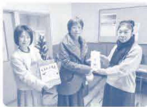
新刊絵本20冊を 贈りました