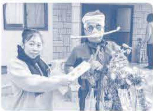
だがしおじさんは 子どもたちの人気者

おがやまコープの納入業者で作る「虫の会」では2020年より岡山県内11施設へお菓子や肉・米など食品の支援を行っています。今年度はおがやまコープ50周年記念としておがやまコープより「新刊絵本20冊」も寄贈しました。井笠エリアでは12月7日(土)に悲眼院の子どもたちに贈りました。