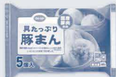
具たっぷり豚まん