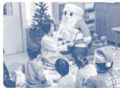
絵本の読みかけをも 行いました