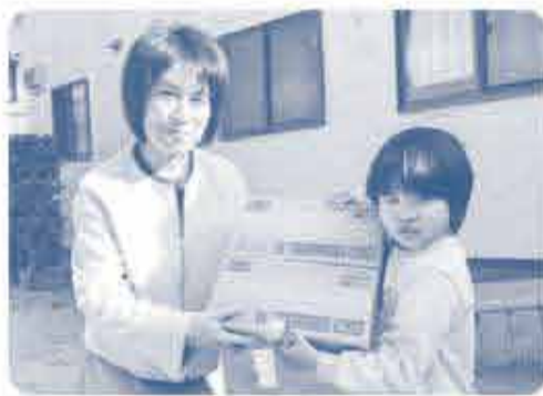
お菓子の他、米、肉 食料品の、デザートも