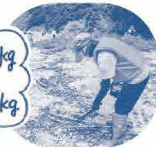
回収にごみと記念撮影