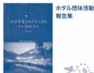
ホテル団体活動報告集