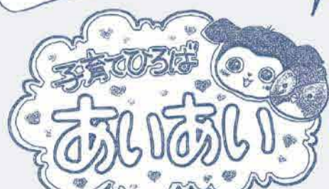
子育て応援プロジェクト