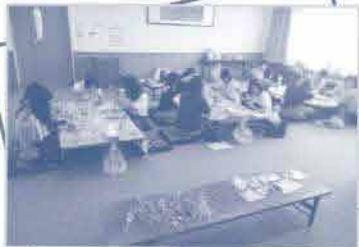
岡田コープ委員会