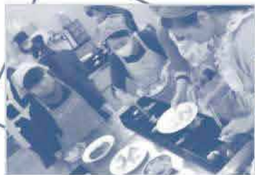
老松南・老松北 コープ委員会