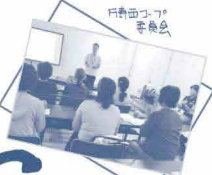
戸崎西コープ 委員会