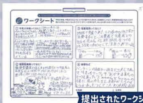
提出されたワークシート

ワークシートには、いろいろな 視点で調べられた結果が 記入されており、CO-OP 商品のこだわりの理解に つながりました!