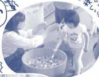
昨年の誕生祭の様子