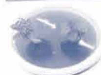
苔玉の水やり方法