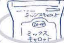
ゴミを楽しくコンパクトにできちゃう♡