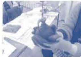
とても楽しく いけました♡