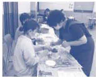
← 先生が優しく 教えてくださいました。