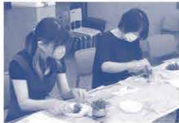
↑自分のペースで 作ることができました。