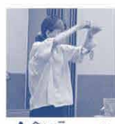
↑今年度のつどいで作った作品です↑