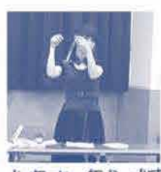
フロッグ新聞の紹介