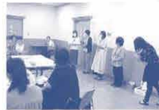
エリアメンバーの紹介もでき まじつながりかことができました