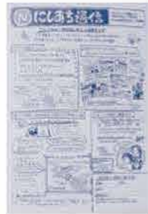
通信を発行して 各委員さんの活動をもっと 広げたいという思いです。