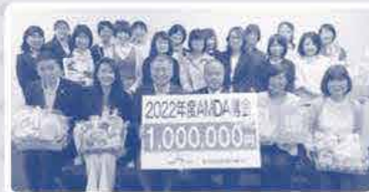
「募金贈呈式」のようす

昨年お寄せいただいた「メッセージ」は丁寧にファイリングした後、AMDA社会開発機構へお渡しし、大変喜んでいただきました♪