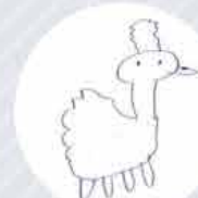
高校生が描いたニワトリの絵の一例