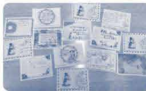
組合員からいただいた 温かいメッセージカード。

「コープいしかわ」より全国の生協 に協力の呼びかけがあり、今回の 募金を活用し「コープいしかわ」 の被災された組合員家庭に、「恩納 村産もずくスープ」と「瀬戸内レモン のレモネード」100セットを皆さん から寄せられたメッセージカードと 一緒に贈りました。