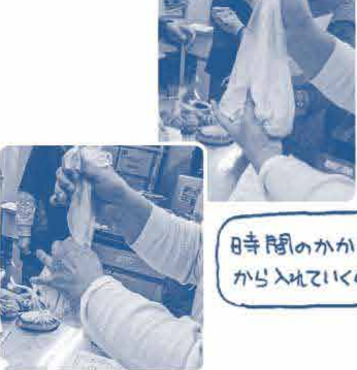
時間のかかる物から入れていくのね