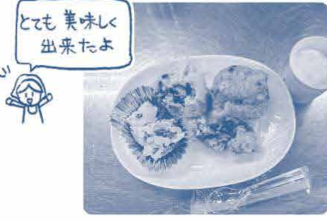
とても美味しく出来たよ