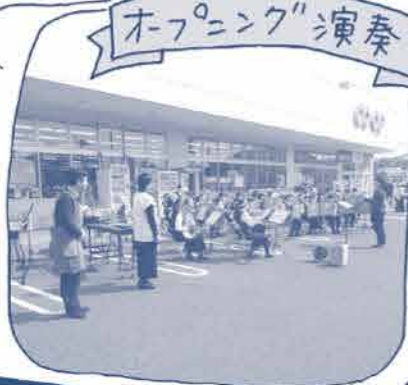
“オフ・オンク”演奏