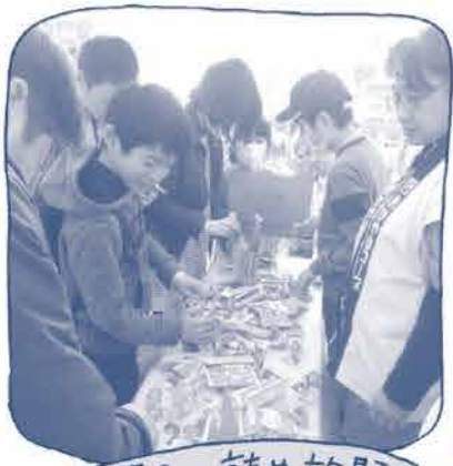
お菓子の詰め放題