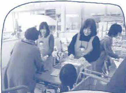
香り当て・野菜当て