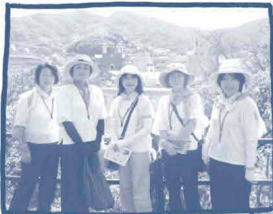
㊦ハッピー国際協カ 支援プロジェクト㊦

○長崎県は山と海に囲まれた自然豊かな異国情緒のある街並です。上を見上げれば真青な青空がとても素敵な県です。碑めぐりでは当時の様子を説明していただき被爆者の話を聞かせていただいたことで改めて原爆戦争の恐ろしさ平和の大切さを実感しました。