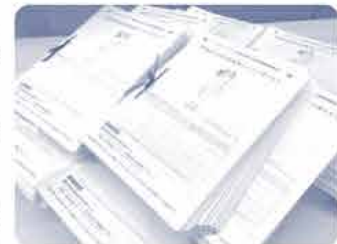
集まった署名用紙

寄せられた署名用紙は、日本被爆者団体協議会に託し、軍縮について議論する国連総会第一委員会に提出されました。全国では、これまでに830万筆の署名が集まっています。