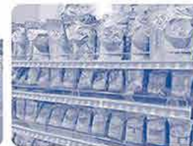
商品ラインナップ