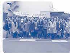
工場前でハイポーズ