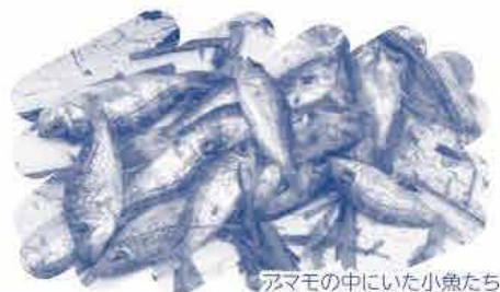
アズマモの中においた小魚たち

※応募者多数の場合は抽選。 おかやま環境ネットワーク個人会員を優先。 参加可否は郵送等でご連絡。