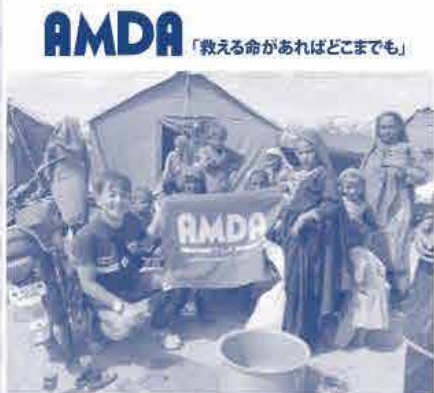
支援のため被災地を訪れた AMDA調整員と村の方々 (パキスタン洪水被災者緊急活動)