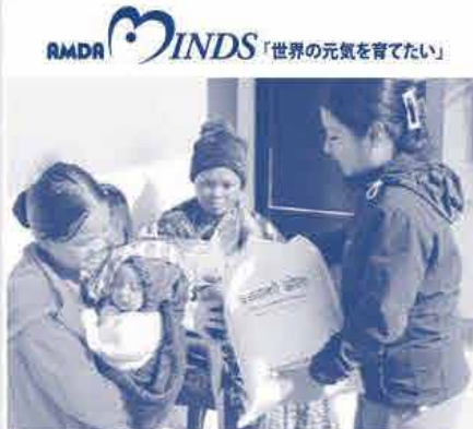
「赤ちゃんキット～おかやまコープ」に 笑顔のお母さん(ネパール)

おかやまコープを通じての募金は税法上の寄付金控除の対象になりません。予めご了承ください。