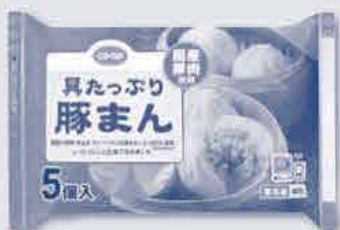
具たっぷり豚まん