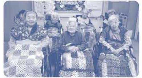
原爆被爆者特別養護ホーム「かめだけ」の皆さんへプレゼント