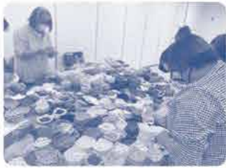
集まったモチーフを仕分け