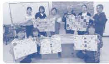
1枚のひざかけに完成