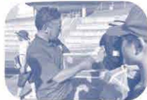
Honey & Coral Project