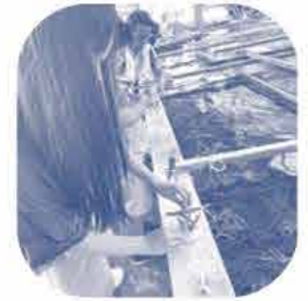
サンゴの苗づくり体験