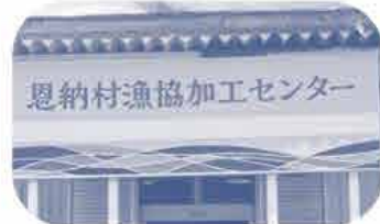
恩納村漁協加工センター