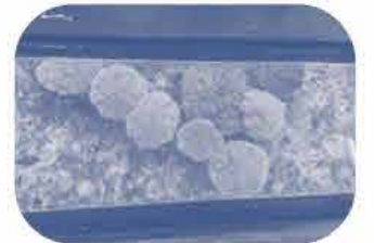
ガラスボードから見たサンゴ