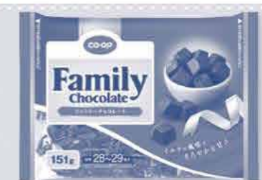
CO-OP ファミリーチョコレート 151g