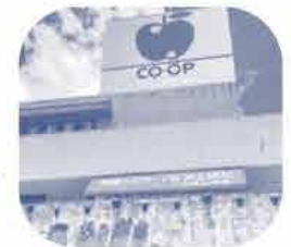
コープおきなわあふろタウン店にも行きました。

今回、「もずく基金」産地見学、交流会に参加して、気軽に食べているもずくにたくさんの方々の努力や関わりがあることがとても良くわかりました。直接、海を守ることはできませんが、消費者としてもずくを買うことで、サンゴ礁再生事業に参加できるので、今までより感謝と応援の気持ちを込めて、もずく商品を買いたいと思いました。