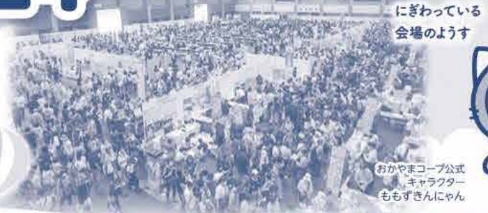
にぎわっている 会場のようす

9月28日(土)、コンベックス岡山にて『コ-オプフェスタ 2024』を開催し、約23,000人が来場されにぎわいました。取引先や生産者など148団体が出展し、Cコレ商品やおかやま育ち、産直・地産地消、エシカル消費などの取り組みを、商品紹介や試食・販売、交流を通じてお知らせしました。