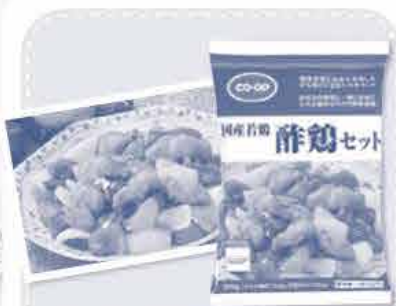
国産若鶏酢鶏セット

コープCSネット5会員生協の組合員が参加して開発された第1号商品。「家族に野菜を多く摂らせたい」「アレンジメニューやかさ増しができるもの」「夕食のおかずで手早く簡単に調理できるもの」など、組合員の声から生まれた商品です。