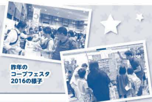
昨年の コープフェスタ 2016の様子

日時 9月23日(土) 10:00～14:30 場所 コンベックス岡山 [大展示場・中展示場]