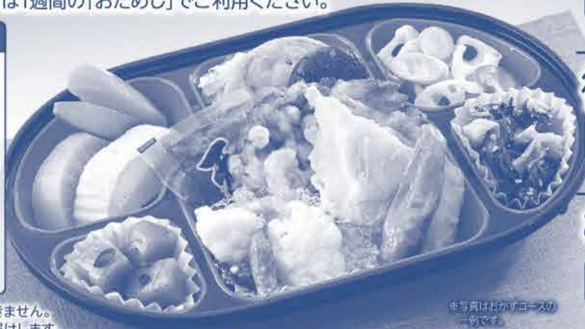
※写真はおかずコースの一例です。