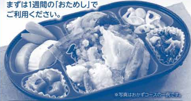
※写真はおかずコースの一例です。