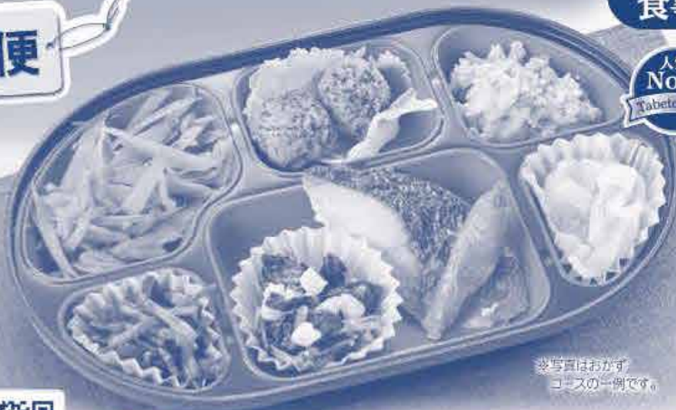
写真はおがず コースの一例です。