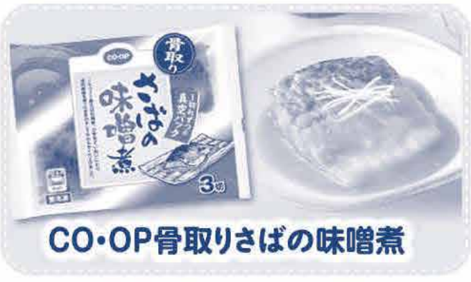
CO・OP骨取りさばの味噌煮