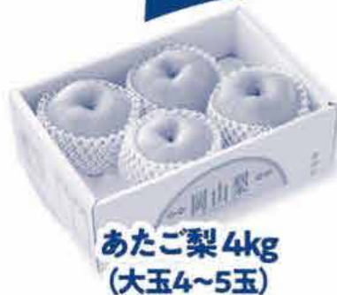
あたご梨 4kg (大玉4~5玉)