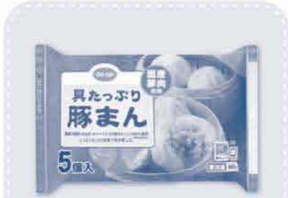
具たっぷり豚まん