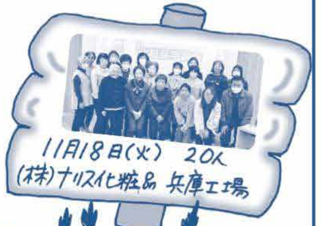
11月18日(火) 20人 (株)ナリス化粧品 兵庫工場

バスの中では クイズや自己紹介をして 好きなコープ商品を 言ってもらって 交流しました!