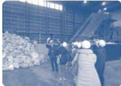
集められたプラスチックごみ