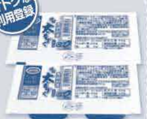
恩納村産 味付太もずく