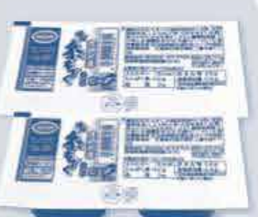
恩納村産 味付糸もずく