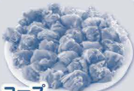
コープ おかやま若鶏