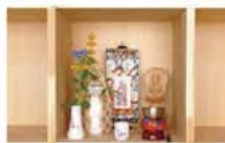
スタンダードタイプ