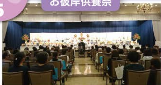
秋季お彼岸供養祭 エヴァホール倉敷にて

ご供養に関わる様々な行事・催し等(上記「お彼岸供養祭」など)をご提案していきます。法事(一周忌供養、三回忌供養)、納骨供養(四十九日供養等)についてもご相談承ります。