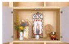
デラックスタイプ